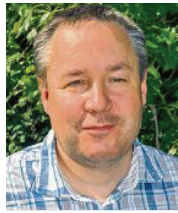
47 lět, z Leppersdorfa překupc/projekt. manager njerěči serbsce Krajny džělowy kruh Ser- bja SPD Sakskeje

3 Wažne su mi nowe jednanja wo wustawkach a financach z pjenjezydawarjami Založby za serbski lud, ale tež financne jednanja z knježerstwomaj Sakskeje a Braniborskeje nastupajo ewaluaciju, zawěšćenje a rozšěrjenje rěčspěchowacych poskitkow na wšěch zakladnych a dalewjeducych šulach/gymnazijach w serbskim sydlenkim rumnje.