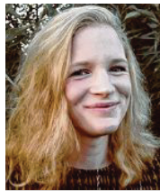
22 lět, z Lipska studentka rěči serbsce Serbska Lěwica

3 Realistisce widžane je najwažniši dypk juristiski zakład: wutworić zjawnowprawnisku korporaciju, zo je sejm zakonce wokruceny. Mi na wutrobie leži, zo so wot spočatka mnohe lubjace ideje serbskich prócowarjow, z wuhladom na rewitalizaciju cyheho luda, k dobremu džělu sejma přiwozmu a wot symješka sem podpěruja.