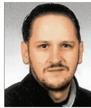
46 lět, z Rownoho samostatny překupc rěči serbsce Lužiska alianca

3 Chcu so zasadźec za naše serbstwo w Slepjanskej wosadze, za serbsku rěč, projekt Witaj, strowy wobswět a jeho škit. Wažne su mi dale kónc wudobyanja brunicy, zachowanje serbskich wšow, pomnikoškit, nowe a humaniše hórnistowe pawo a klimowy škit (COP 21).