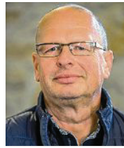
61 lět, z Kočiny diplomowy inženjer za ra- tarsku techniku rěči serbsce Smy z.t.

3 W padže wuzwoljenja budu so za to zasadźeć, zo so wo wšitkich wobydlerjow njewotwisnje wot rěče a pochada, kotřiž w serbskim sydlenkim rumnje bydla, staromy. Chcemy docpěć, zo so starši z rěčne widžanych mješanych mandželstwow nastupajo kubljanje za to rozsudzaj, zo jich džěći serbske kublanišćo wopytaja a tak hižo w pěstowarni serbsku rěč nawuknu. Přetož džěći su přichod, wone rěč a kultura dale zachowaja.