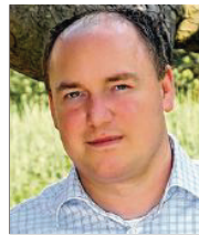
41 lět, z Wětošowa specialne transporty, wotnajer wuknje delnjoserbsce Lužiska alianca

3 Mam skrućenje serbskeje rěče na šulach a w pěstowarnjach za wažne. Zasadźec ču so za to, zo w serbskim wobtuku dale polnočasowe džělowe městna nastanu. Dalši wobtuk je turizm. Jón we Lužicy wódwěw, to sym sej w padže wuzwoljenja předewzał.