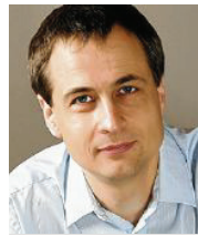
44 lět, z Delnjeho Wunjowa inženjer wuknje serbsce Krajny džělowy kruh Ser- bja SPD Sakskeje

3 Serbskemu ludje ja so prawniska wosoba spožić jako korporacija zjawneho prawa ze sejmom jako legislatiwu na zakladže statneho zrěčenja mjez Sakskej a Braniborskej. Prawa a winowatosće nastupajo nutrkowne samopostajowanje w kulturnych a džěla kublanskich prašenjach (2. statne zrěčenje) wujednać. Dže wo to, Witaj, žplus a rěčne kubljanje za dorosčenyh kwantitatijnje a kwalitatijnje polěpsjeć. Chcu so zasadzić za polne programy w hornjo- a delnjoserbskej rěči w rozhlusa a telewiziji.