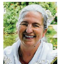
57 lět, z Mužakowa samostatna přewodnica hosći Lužiska alianca

Kandidatka njeje naprašnik najebać prócowanje redakcije Serbskich Nowin nastupajo swoju „wizitku“ bohužel wupjelnila a njeje ničo zapodała.