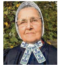
80 lět, z Rownoho rentnarka rěči serbsce Lužiska alianca

3 Chcu so za to zasadźec, zo so sydlenke kónčiny našeho ludu tež za přichodne generacije zachowaja (wnučkokmanosć). Z tym zwjazane su serbska rěč, kultura a přiroda, ale runje tak materielne kubla přjedownikow. Žana wjes, žadny žiwjenski rum mjeńšiny njesmě so hižo brunicy woprawac.