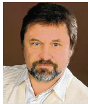
58 lět, ze Sedlišca (Sedlitz), město Zły Komorow teolog, socialny pedagog njerčiči serbsce Smy z.t.

3 Bych rady tych za jich naležnosće zajimował, kotřiž su w šěrym pasmje mjez serbskej identitu a němskimi abo njemjenowanymi rudimentami identitu žiwi. Štóž njewě, zwotkel pochadza, tón tež njewě, dokal ma hić. Chcu k tomu přinošowac, zo su ludźo w swojej domiznje zakorjenjeni, zo su kručac za swojsku identitu žiwi po hesle: Stejimy k swojemu pochadaj a chcemy přichod, kotryž skići nowu nadžiju a njeje žane wohroženje. Na kóždy pad chcu so na tymle napjatym procesu wobdźělic a sobu pomhać přichod wuhotowac.