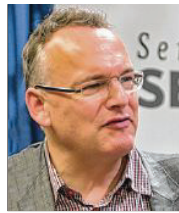
54 lět, z Drježdźan lěkar, předewzačel rěči serbsce Stup dale z.t. Drježdźany

3 Bytynse je skrućenje serbskeho sebjewědomja jako woprawdže runohódny, konstitutiwny džělny statny lud w Němskej a posředkowanje zrozumjenja za to, zo je přičina chroniskeho podfinancowanja serbskeho kulturneho sistema na wšěch runinach eklatantny njepoměr mjez dawkami, plaćenymi wot Serbow do cylostatneho němškeho sistema, a šrědkami, kotřež jako jalmožny přez Založbu za serbski lud dostanu.