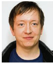
33 lět, z Drježdžan kulturny manager a hudźbnik čita a rozumi delnjoserbsce Šup dale z.t. Drježdžany

3 Moja naležnosć je zhromadne skutkowanje wšěch institucijow. Na jedneje stronje dže wo financne a kulturne spěchowanje, wo ničenje serbskeho sydlenkeho ruma brunicy dla abo wo turisticke móžnosće (strukturnu změnu). Nimo toho su to kublanskopolitiske prašenja, kaž na přikład rozšěrjenje serbskeje wučby a dohladowanje džěči. Na europskej runinje je wuměna z dalšimi mjeńšinami wažna, runje hladajo na Europu regionow.