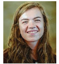
22 lět, z Berlina studentka rěči serbsce Domizniske a kulturne towarstwo Njebjelčicy z.t.

3 Jako přenje je wažne, so wo legitimowanje Serbskeho sejma starać. Jenož jako legitimny gremij móžemy dotalne struktury přewinyć a na samopostajowanju našeho přichoda dźělać.