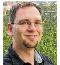
27 lět, z Budyšina stawiznar rěči serbsce Smy z.t.

3 Zdžežanje wustawy je přejnotny nadawk přenjeho sejma. K tomu je njewobedźimne so tež z etablowanymi akterami wujednać – wosebje z Domowinu. Chcu so wo spěšne a za wšitkich serbskich akterow spokojace dojednanje prócować.