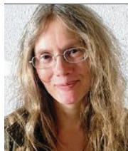
51 lět, z Berlina wučerka njerčiči serbsce Pónaschemu z.t.

3 To najprjedy wot wólbneho wobdźělenja wotwisuje a wot toho, što móžemy na tym zakladže scyła započec. Rólu hraja dale wočakowanja našich wolerkow a wolerjow. Budu-li wuzwolena, budu so konstruktiwne jako Serbowka zasadźec.