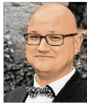
34 lět, z Kamjenca hladar starych njerěči serbsce Krajny džělowy kruh Ser- bja SPD Sakskeje

3 Chcu so přefično hidže a šćuwarić zasadźeć. Dwurěčnost njeměli jako dyrbižnu, ale jako šansu wobhadlować, na přikład ze serbskimi rěčnymi poskitkami tež na němskich šulach a pěstowarnjach. Wažnej stej respekt a toleranca mjez Serbami a Němcami a migrantami.