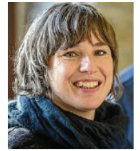
41 lět, z Huštanja (Wüstenhain), město Wětošow diplomowa hospodarka rěči delnjoserbsce Pónaschemu z.t.

3 Moje polo je kublanska politika. Džěči a jich rěč/e su přichod! Wjacerěčnosć ma telko lěpšin. Lužica je wjacerěčna, štož mamy zachowac a zesylnić. Džěči měli so tu zakorjenic a wšitko za to činić, zo Lužica rozkćeje. Džěči su přichodni tworicieljo hodnotow!