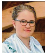
18 lět, z Dubjeho (Eichow), gmejna Golkojce wučownica rěči delnjoserbsce Pónaschemu z.t.

3 Za mnje ma kublanje wosebje wulki wuznam. Džěčom a mlódstnym dyrbymi wjace šansow skićić, zo bychy sej hižo w pěstowarni abo w zakladnje šuli rěč a ludowe naložki zblížili a so z nimi zaběrali.