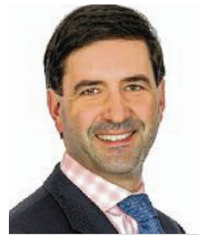
45 lět, z Rakec diplomowy překupc rěči serbsce Smy z.t.

3 Najwažniša naležnosť je mi samopostajene wukublanje serbskich kubljarjow a wučerjow. To zaručić synly zakład za wukublanje přichodnych generacijow serbskich džěći.