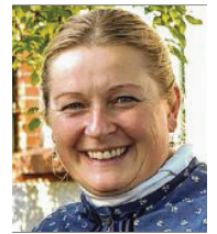
49 lět, z Ptačec samostatna serbsce njerčić Smy z.t.

3 W našej domiznje šerja aktiwne towarstwa wědu wo našich přjedownikach. Jich bōže podpěrać, wo to chcu so prócować. Runje tak su rozmołwy a dorěčenja z Domowinu a Založbu za serbski lud wažne, zo bychmy zhromadnosć docpěli.