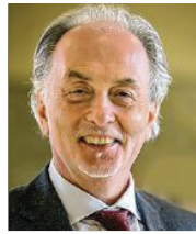
65 lět, z Berlina lěkar rěči serbsce Stup dale z.t. Drježdźany

3 Za wažne wobtuiki mam rěčne wukublanje našeje mlodeje inteligencij, polěpsić šulsku strukturu a atraktiwnosć serbskeho sydlenkeho rumja.