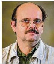
55 lět, z Wuskidze rjemjesniski mišter njerčić serbsce Smy z.t.

3 Mi dže wo narodne wujednanje nastupajo přewroty w stawiznach, wo wustawu na zakładze rezolucije Zjednocenych narodow 61/295 a spočćenje statusa korporacije zjawneho prawa za serbski lud, docpěć statne zřecenje mjez druhim wo financowanju kulturneje a kublanskeje awtonomije, a wo to, skrućić regionalne wosebitosće kaž je to wjacerečnosć we Łužicy.