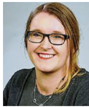
37 lět, z Drježdźan finančna maklerka rěči serbsce Stup dale z.t. Drježdźany

3 Spočatnje zasadźuju so za wutworjenje Zhromadźenstwa Serbow jako korporacije zjawneho prawa. Je zakład za wujednanje prawow z knježerstwom. Polěpsić maja so kublanske struktury a marketing serbskeho luda, štož je nowy hospodarski potencial. Při tym kladu wažnosť na transparencu, mosćik mjez ludom a Serbskim sejmom.