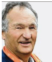
61 lět, z Bórkowow/Błóta dipl. agrarny inženjer rěči serbsce Pónaschemu z.t.

3 Budu-li wuzwoleny, chcu so zasadźeć za wučbu serbsčiny a Witaj w zakladnych šulach. Za to, zo kulturne serbske naložki tak rozkćeja, kaž su prjedy raz byli. Na přikład, zo widźimy na zapuće zaso tradicionalne postawy kaž dwuwobličo abo mjejdweđa a nic nowe cuze elementy. Tež nastupajo serbsku rěč měli wotwěrjeni za dalewuića być.