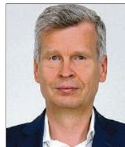
57 lět, z Drježdžan inženjer jednačel rěči serbsce Stup dale z.t. Drježdžany

3 Najwažniši nadawk budže, bazu Serbskeho sejma rozšěrjeć, wobmyslenja wotwarjeć a wšitke demokratiskie mocy zjednoćec. Dalsje šćepjenje a rozšěrjenje našich snadnych narodnych resursow sebi dowolić njemóžemy.