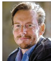
48 lět, z Huštanja (Wüstenhain), město Wětošow dipl. agrarny ing., jednaćel rěči delnjoserbsce Łužiska alianca

3 Chcu so prócować wo narodne wjednanje k stawiznimskim přewrotom wosebje w lětach 1945–2000, džělać za wustawu na zakladže rezolucije Zjednocenyh narodow 61/295 a za wutworjenje korporacije zjawneho prawa za lud Serbow. Jako dalše temje stej mi wažne nowe jednanja nastupajo statne zrěčenje wo financowanju kulturneje a kublanskeje awtonomije kaž tež zesyljenje dwurěčnosti we Łužicy.