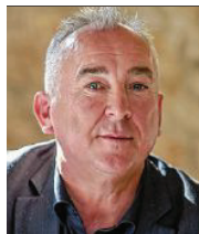
54 lět, z Njebjelčic wjesnjanosta, rěči serbsce Domizniske a kulturne towarstwo Njebjelčicy z.t.

3 Přeni krok budže so wo připóznaće wólbow starać. Dale chcu so zasadzić za paritetiske wujednanje nadawkow mjez Hornjeje a Delnjeje Łužicy.