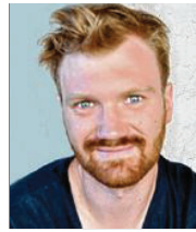
24 lět, z Chrósćic samostatny ekologiski ratar rěči serbsce Łužiska alianca

3 Steju za sprawnosć a transparentnosć w mjezsobnym cyłku a chcu tuž, zo w přichodze wšityc za jedyn potronk čehnjemy – so potajkim z cyłte wšelakorosću na zhromadny přichod měrimy – a zo so šćuwanja a tukanja na jednotliwych runinach wotstranja.