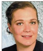
37 lět, z Wětošowa inženjerka wuknje delnjoserbsce Pónaschemu z.t.

3 Zasadzić chcyła so za nowe jednanja nastupajo statne zrěčenje wo financowanju kulturneje a kublanskeje awtonomije, dale za skrućenje serbskeje rěče kaž tež za wustawu na zakladže rezolucije 61/295 Zjednocenyh narodow a za wutworjenje korporacije zjawneho prawa za lud Serbow.