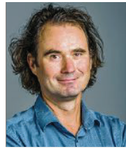
49 lět, z Hogrozneje (Ogrozen), město Wětošow transformaciski wědomostnik njerčiči serbsce Smy z.t.

3 Wobdźělu so na tym ze swojeho wida trěbnu transparentu socialnych, towaršnostnych a politiskich počahow takle zmóžnić, zo docpěwa wobdźělenje (participacija) formu, z kotryž dohromady, jako w regionje a zwonka njeho žiwi ludźo, woprawdźići wobdźělenje na rozsudach nazhonimy.