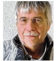
66 lět, z Cerska (Tschernitz) diplomowy inženjer njerčiči serbsce Pónaschemu z.t.

3 Mam dekret wo nutrikownym a wonkownym měrje za wšy. We Lužicy měli 10000 drjewjanych domskich natwarić a 10000 čoplotnych klumpow instalowac, zo móhli ludźo w zymje ze zymnym powětrom tepic. 250000 kubiknych metrow zezawoweho blóta ze Sprjewje njeměli skladowac, ale za twar drohow wužiwać.